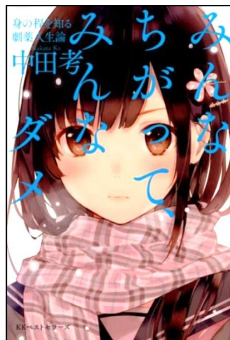
『みんなちがって、みんなダメ』 中田孝著 (KKベストセラーズ)

日本人の多くが他者評価や世間の目を気にし過ぎて悩むのは、私たちが神様を持っていないせいかも知れない。(増山)