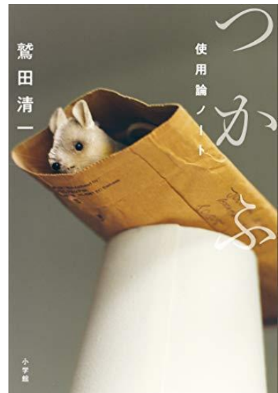
『つかふ 使用論ノート』 鷺田清一著(小学館)

たとえば人や地域がもともと持っていた機能は、公共のサービスを得ることで置き換わり、拡張される。ただし同時に退化を招くことも否めない。